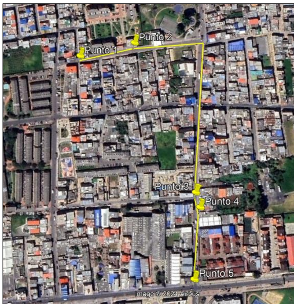
Ilustración 1. Recorrido verificación ambiental

Con base en lo anterior, el día 10 de octubre de 2024 se realizó recorrido de control y vigilancia en el barrio Serrezuelita desde las coordenadas 4°42'23,956"N- 74°12'33,093"W hasta las coordenadas 4°42'34,608"N- 74°12'25,11"W (ver ilustración 1. Ruta amarilla).